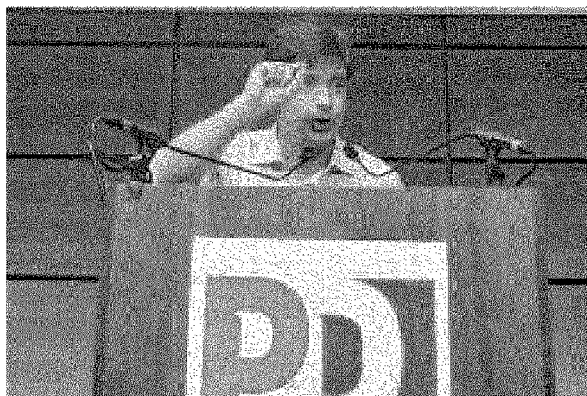
Giuseppe Civati parla all'assemblea di ieri a Torino

Carla Fracci sarà assessore alla Cultura della Provincia di Firenze. "Mio primo obiettivo è valorizzare i giovani" ha promesso l'"étoile", che risiede nella campagna fiorentina