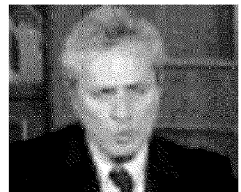
Francesco Rutelli, presidente del Copasir

Fonte: Eurobarometro; Istituto superiore di sociologia; Abacus; Ipsos