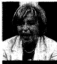
Marta Vincenzi È sindaco di Genova dal 2007