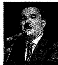
Romano La Russa Assessore regionale dal 2008