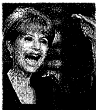
Lilli Gruber A Otto e mezzo: ha lasciato a settembre