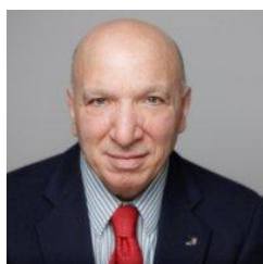
Rocco Di Trolio (Camera)